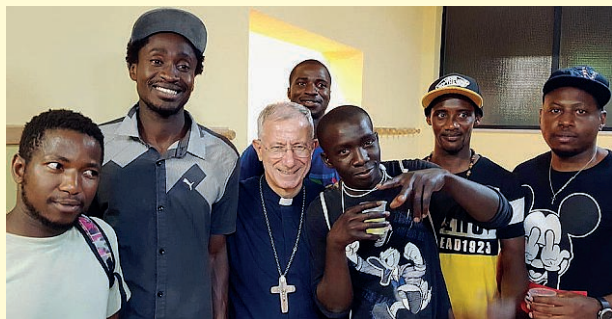
Il vescovo all'inaugurazione della Casa di accoglienza.

Lo stesso è stato per il G7 dell'economia prima e del G20 nel 2021. Nella nostra Chiesa sono nate alcune cooperative, frutto del progetto Policoro sostenuto dalla Cei, che lavorano con competenza sull'intero territorio. Lungo l'anno organizzano mostre a carattere culturale, spirituale, momenti di riflessione, concerti, itinerari, che diventano un'opportunità per un tuffo nella storia meditando e pregando».